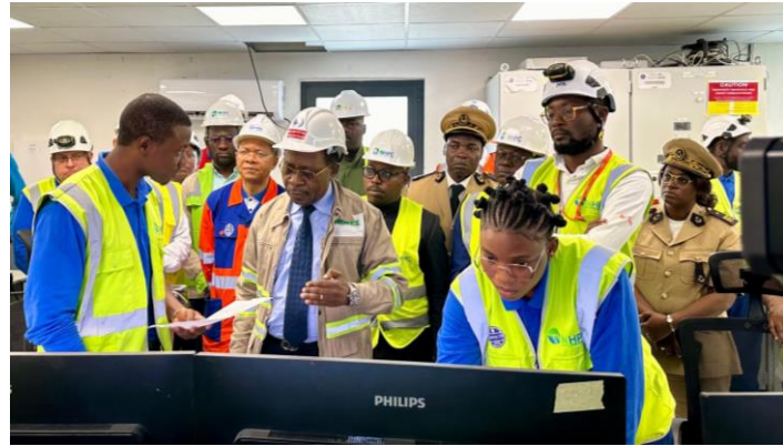
Le Ministre de l'Eau et de l'Energie dans la salle de commande de Nachtigal

A la livraison complète du projet en début 2025, l'énergie produite par Nachtigal permettra de couvrir près de 30% des besoins énergétiques du Cameroun.