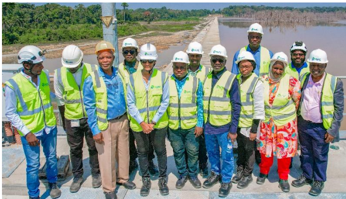
Photo de groupe devant le barrage principal

Ce type de collaboration renforce les liens entre les acteurs du secteur énergétique et contribue à faire progresser une vision commune d'une hydroélectricité durable et responsable pour le continent africain.