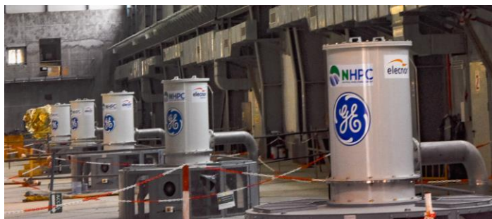
Vue sur les 5 groupes de Nachtigal en service

NHPC maintient son ambition de livrer l'ensemble de l'aménagement hydroélectrique de Nachtigal en début 2025 afin d'assurer au Cameroun une fourniture d'électricité verte, disponible et compétitive.